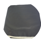
COUVERTURE DE PROTECTION POUR SOUDEUSE