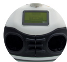
TRAPPE À MAIN