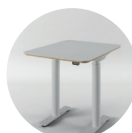
TABLE RÉGLABLE EN HAUTEUR