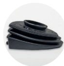
SUPPORT RÉGLABLE POUR MICROSCOPE (5°-25°)